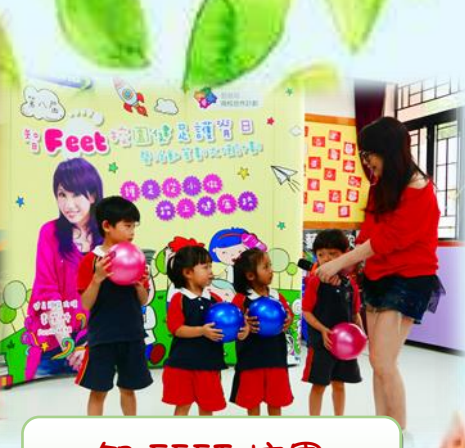
智 FEET 校園 健足護脊講座