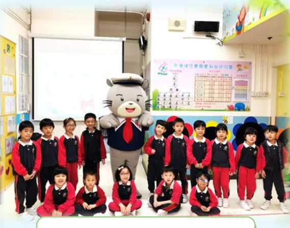
「威威與好友」 閱讀同樂日