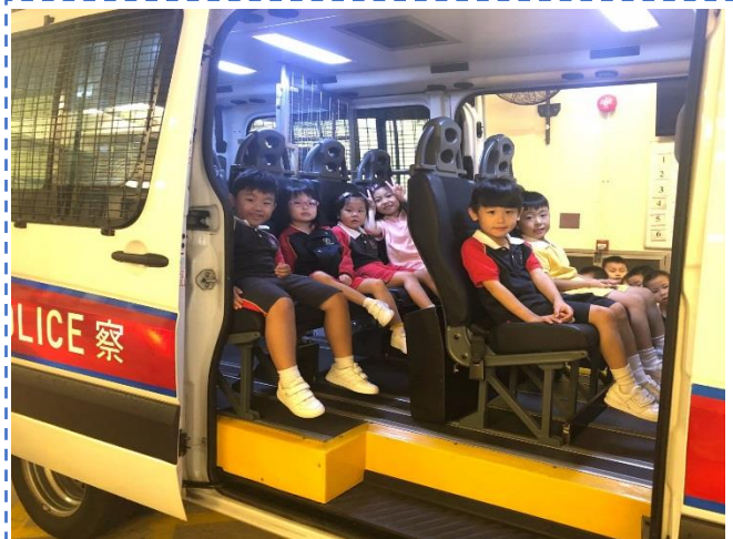
K3 班參觀馬鞍山警察局