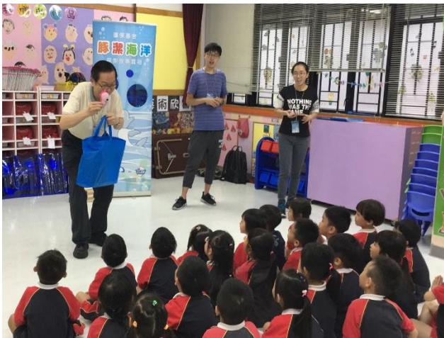
K2 班「豚潔海洋」探索一故事講座