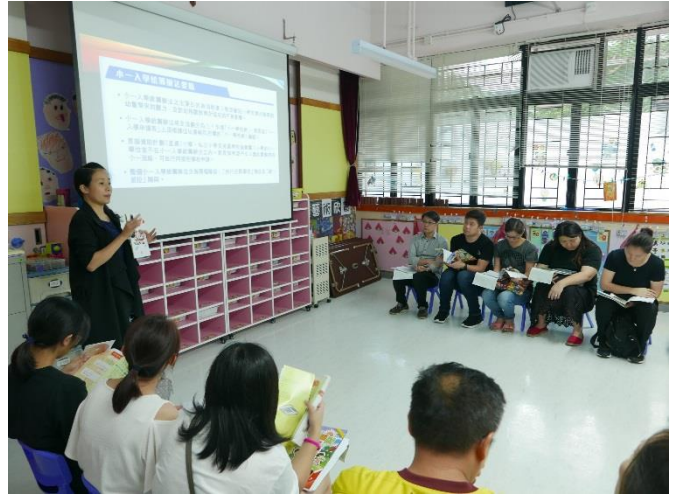
小一入學申請講座