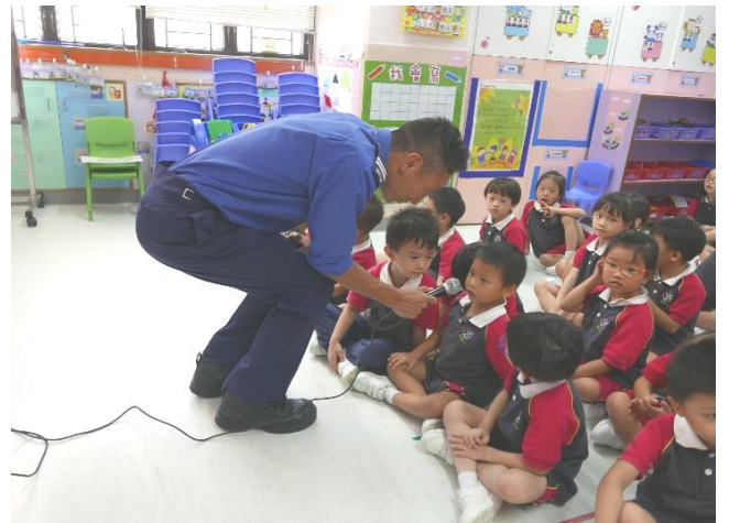
K2 及 K3 班消防講座