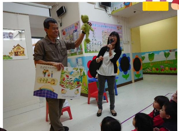
一粒可持續咖啡豆講座