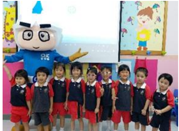
中華電力「看到的電力」講座