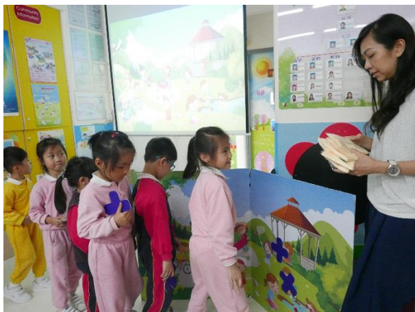
漁農署郊野公園講座