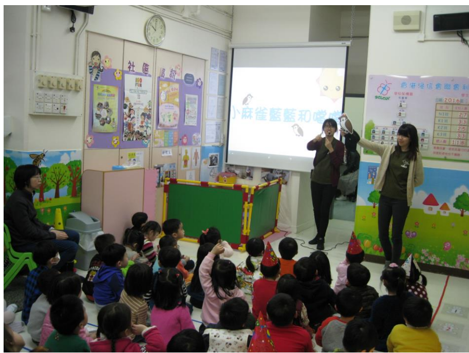
發現香港城市自然生態暨全港麻雀講座