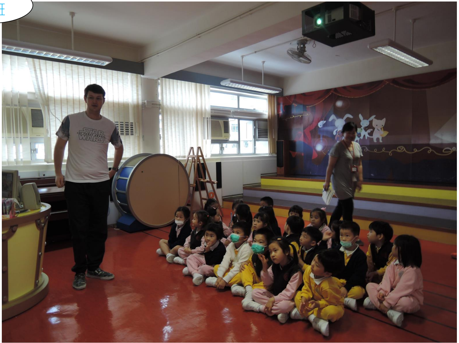
K2 班的小朋友參觀禧年小學，體驗小學的上課模式。