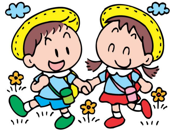
K3 班到香港迪士尼樂園， 小朋友都表現得十分雀躍。