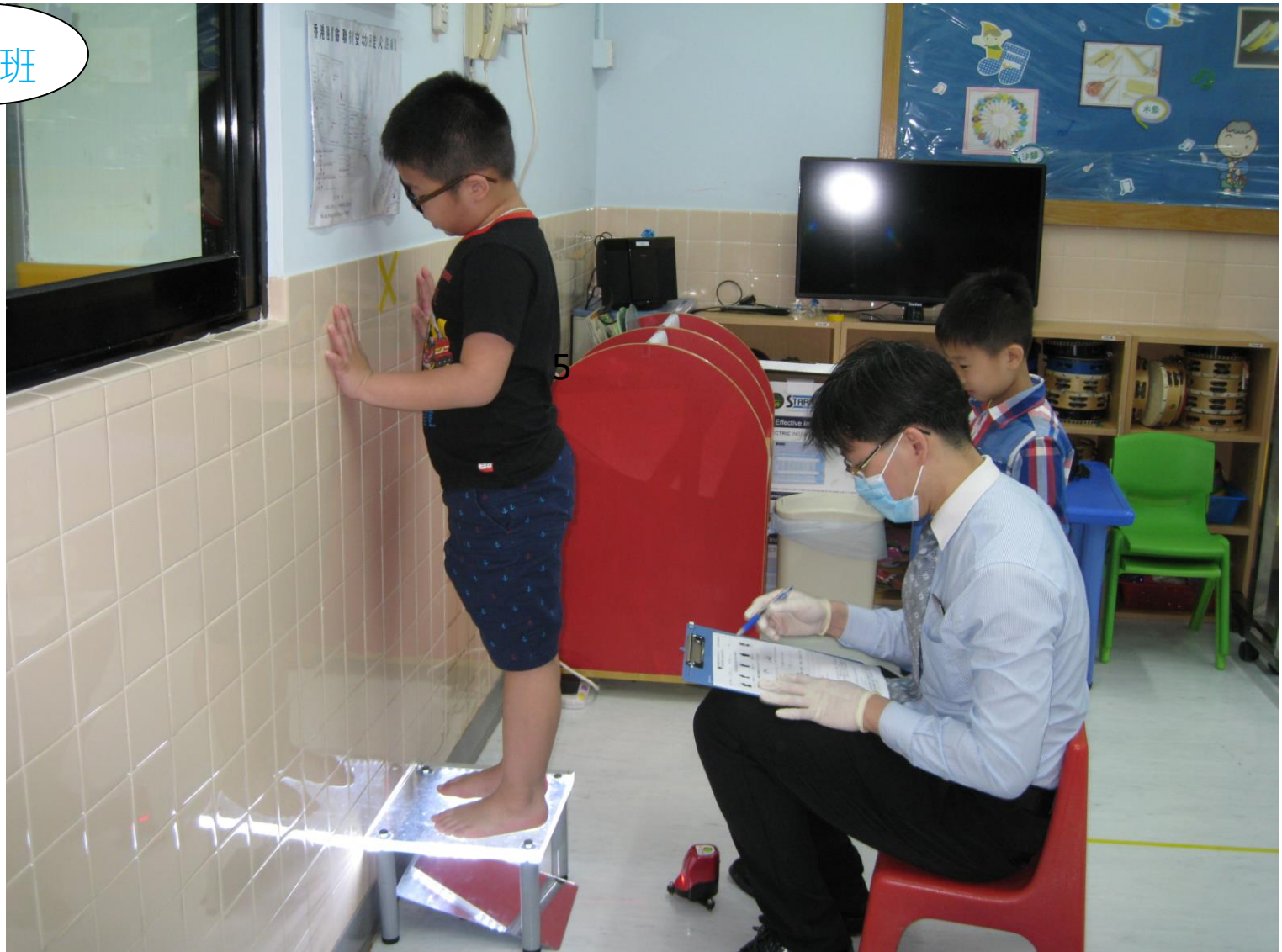
K3 班的小朋友進行足部檢查，確保足部健康發展。