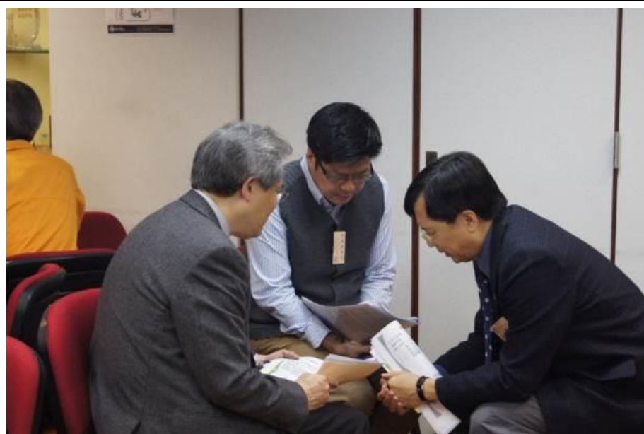
1月7日舉行的「關愛四川留守兒童」 異象分享會，事工委員會成員 及一眾參與者同心禱告