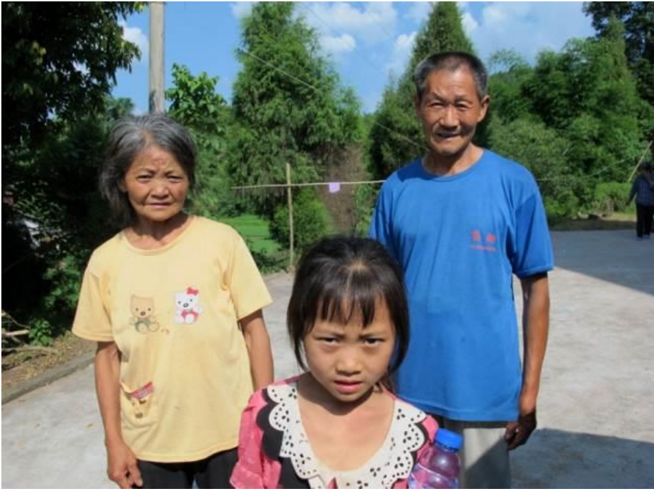
農村的留守兒童因父母離鄉工作， 只可交由年長的親友照顧

隨著中國經濟的發展一日千里，由農村到城市工作的農民數量激增。外出工作的父母只好把子女留在家鄉，交由祖父母照顧或寄養在親友家中，然而有一些兒童只可以單獨留守而沒有任何人照料。他們就是所謂的「留守兒童」。