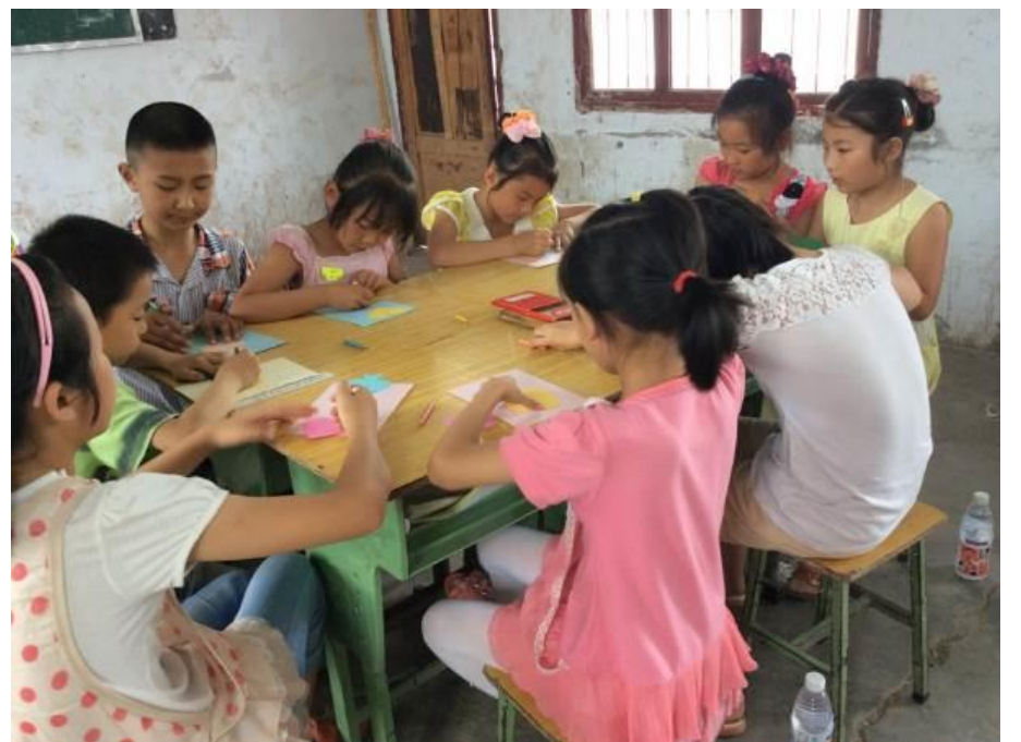
農村的留守兒童資源不足， 學習環境不甚理想

*資料來源：《中國兒童發展指標圖集》(2014)，由聯合國兒童基金會、國務院婦女兒童工作委員會辦公室和國家統計局共同編著。